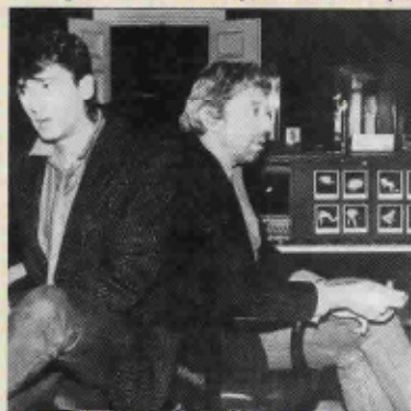
RENCONTRE En 1982, Gainsbourg avait collaboré à Play blessures , de Bashung.

monies, relate ce dernier. Puis Alain a posé sa voix sur des maquettes. Il évoquait peu l'œuvre de Serge mais a lâché à propos du côté très sexuel de cet album : "Quand même, il était gonflé". » Puis le chanteur se consacra à son ultime CD, Bleu pétrole - les fans auront remarqué que la Marilou de L'Homme à tête de chou « se plonge avec délice dans la nuit bleu pétrole ».