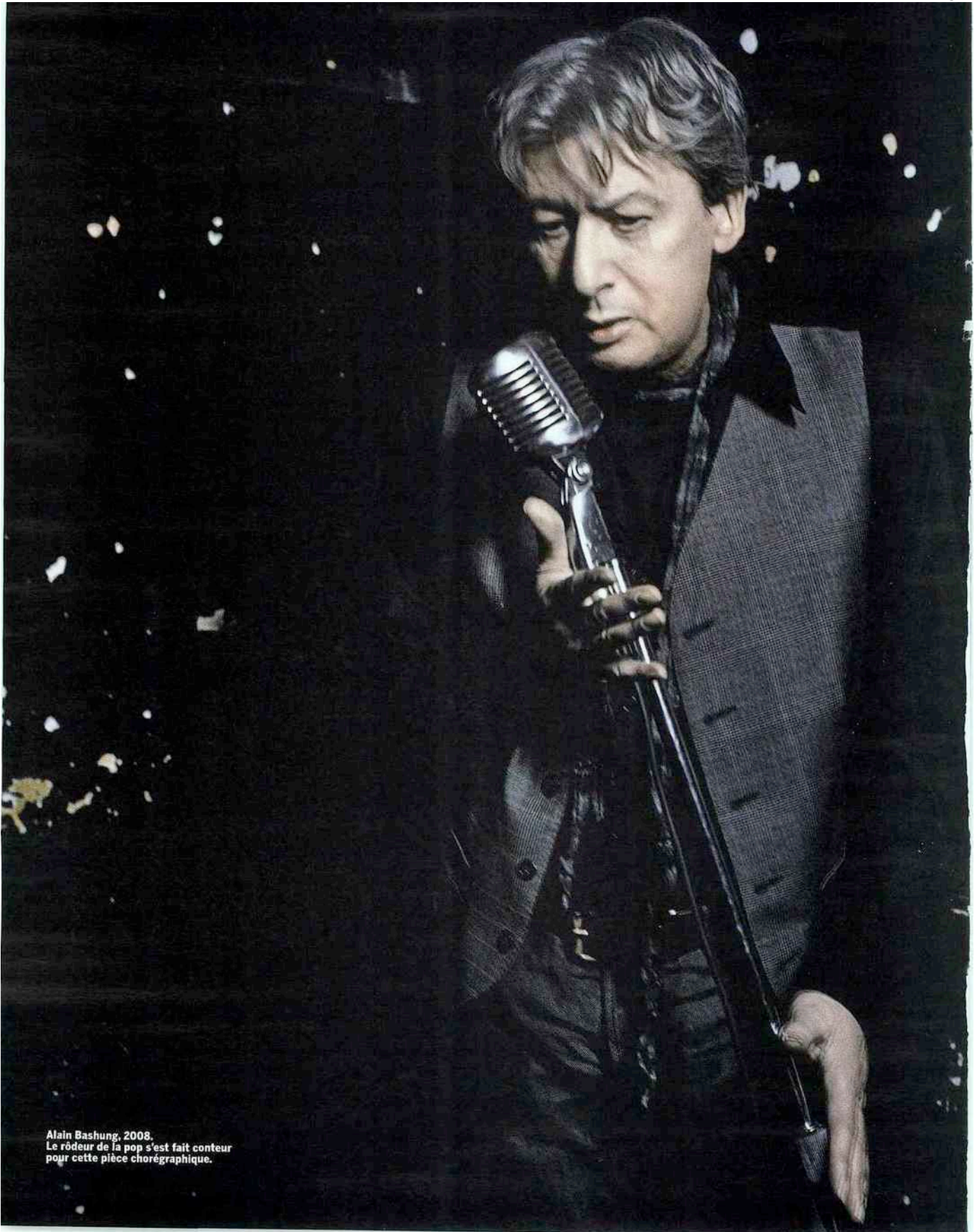
Alain Bashung, 2008. Le rôdeur de la pop s'est fait conteur pour cette pièce chorégraphique.