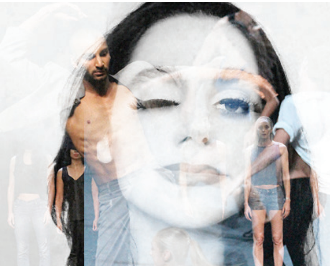
Montage E.G. d'après la photographie de My Rock - © Guy Delahaye et le portrait de PJ Harvey - © source internet.