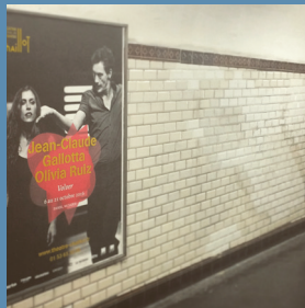
Paris - octobre 2016