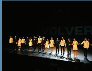
Paris - octobre 2016