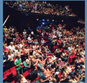
Lyon - septembre 2016