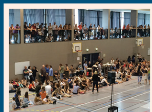
Suite aux intempéries du samedi 25 juin 2016, la journée initialement prévue dans le parc d'Uriage s'est déroulée dans le gymnase d'Uriage.