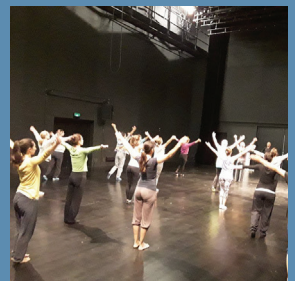
Dunquerque - Octobre 2016