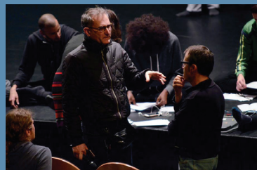
Herblay - novembre 2016