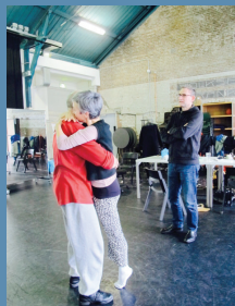
Rotterdam - février 2016