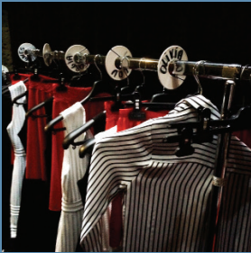
Lyon - septembre 2016