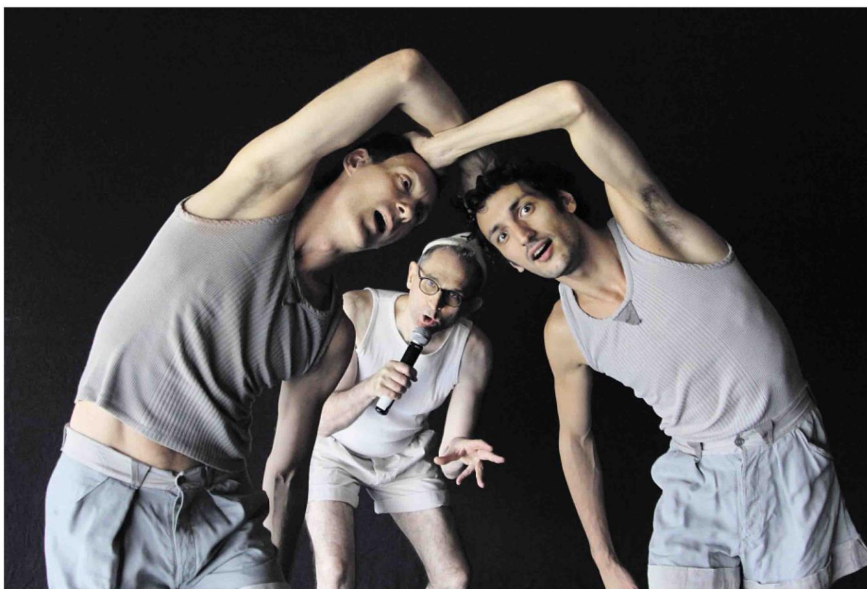
Jean-Claude Gallotta a adapté sa pièce iconique, « Mammame », en y injectant des éléments narratifs aux parties de danse. GUY DELAHAYE

Blanca Li et Jean-Claude Gallotta se tiennent aux deux extrémités de la cartographie de la danse française. La première, andalouse, gymnaste de formation, installée en France depuis 1993, appuie sur le champignon de comédies chorégraphiques souvent théâtrales et multimédias, proches de shows. Le second, passé par les Beaux-Arts de Grenoble, figure de proue de la danse contemporaine depuis le début des années 1980, a forgé une écriture à nulle autre pareille, infiniment subtile dans ses articulations, irréductiblement vivante dans son élan. Bondissante et vive, brodée d'humeurs explosives, elle exacerbe la volubilité de corps en état d'urgence et cavale sur la piste d'émotions paradoxales. A première vue sans point commun, ces