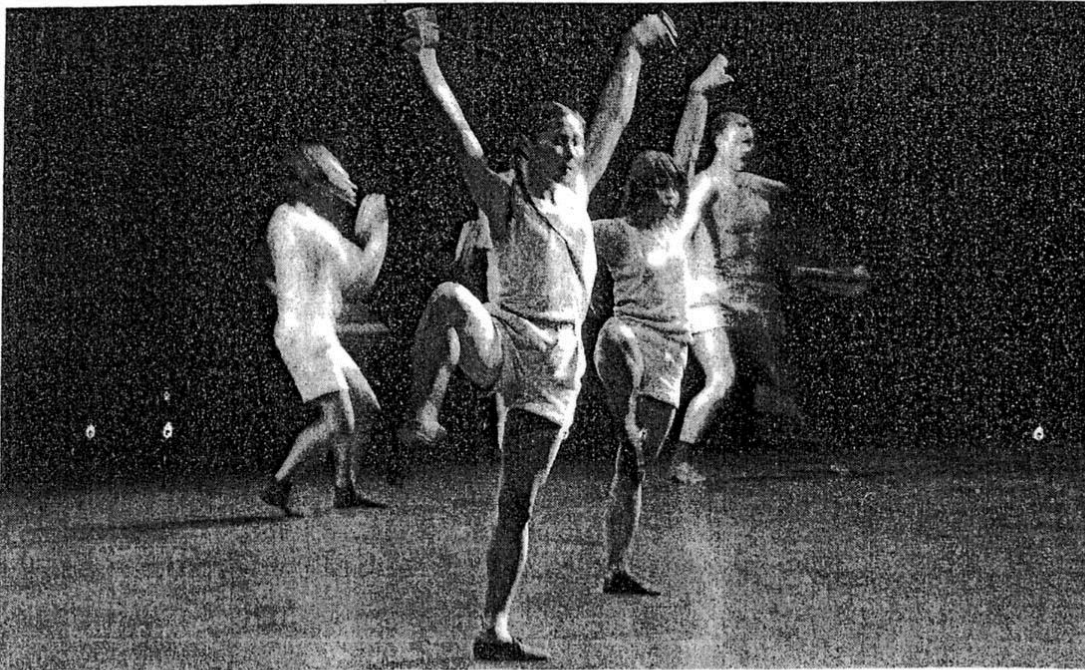
Se mouvoir pour un rayon de soleil.