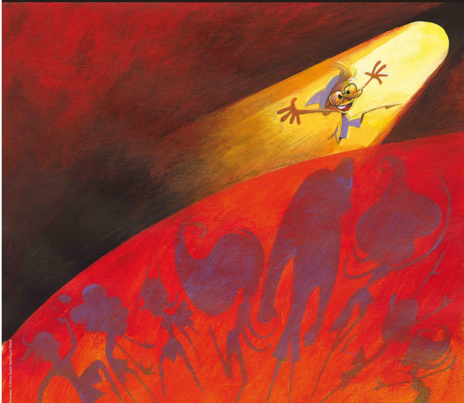
Illustration © Oliver Supan, édition p'tit Glenat

PRODUCTION CENTRE CHORÉGRAPHIQUE NATIONAL DE GRENOBLE